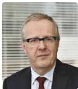
Thierry LE GOFF, Directeur général de l'administration et de la fonction publique

Avec cette formation commune, l'Allemagne et la France offrent une occasion unique de se préparer aux nouveaux enjeux de la coopération administrative en Europe.