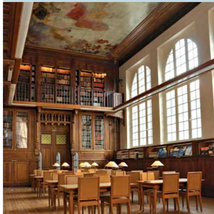
La bibliothèque de l'ENA, aujourd'hui

Chaque année l'ENA accueille environ 120 élèves en cursus initial et plus de 2500 fonctionnaires et cadres dirigeants en formation continue. À la diversité des élèves français recrutés par la voie de 3 concours distincts, s'ajoute celle des élèves étrangers des cycles internationaux. En soixante années d'existence, l'ENA a formé plus de 6500 hauts fonctionnaires français et 3000 étrangers représentant plus d'une centaine de nationalités. Environ 1300 personnes originaires du monde entier participent chaque année à des séminaires et visites d'études sur les deux sites de l'École, à Strasbourg et à Paris.