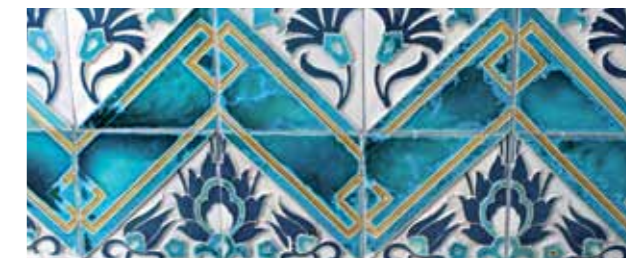
Frise de la manufacture nationale de Sèvres

En 2002, l'ENA fusionne avec l'Institut international d'administration publique.