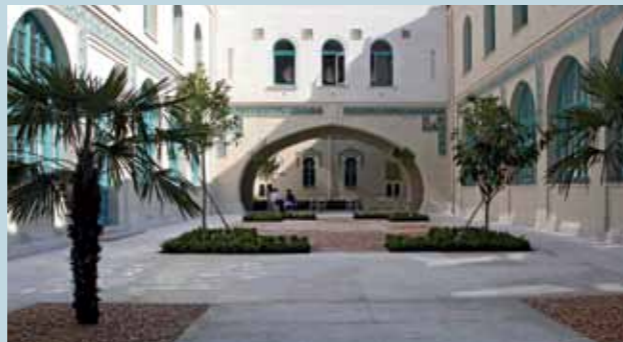
Le patio rénové

Des travaux de rénovation de la façade, des boiseries, des mosaïques et l'aménagement du Patio ont été effectués en 2008 pour redonner à l'École son aspect initial.