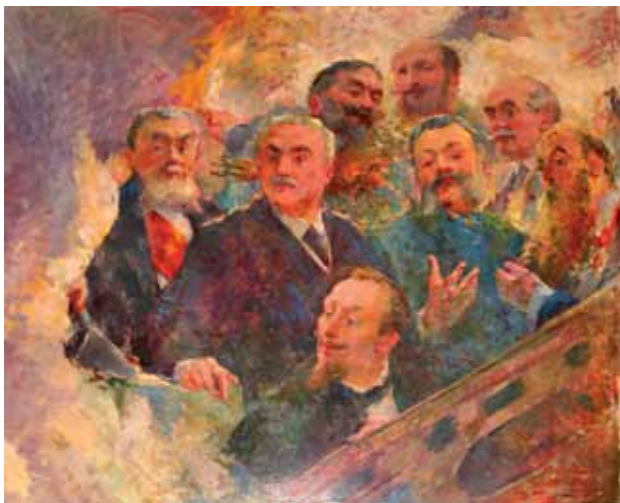
Peinture du plafond de la bibliothèque