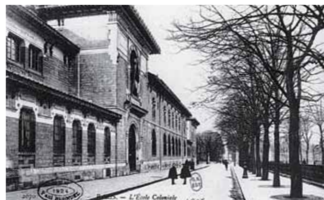
Carte postale de l'École coloniale, 1907

En 1257, Saint Louis fit don des ruines du château à l'ordre des Chartreux, qui y fondèrent un monastère. Celui-ci prospéra jusqu'à la révolution française lorsque la Chartreuse de Paris devint « bien national ». Les religieux quittèrent alors le couvent qui fut un moment converti en fabrique de poudres et salpêtres. En 1801, Napoléon fit installer une pépinière ouverte au public jusqu'en 1848. Le terrain devint alors un enjeu permanent entre administrations puis fut divisé en trois lots. Le premier, en 1876, compris entre l'avenue de l'Observatoire et la rue d'Assas fut réservé à la construction de l'École de pharmacie. Le second, attribué au ministère de l'Instruction publique, accueillit en 1891 le lycée Montaigne, le troisième enfin fut attribué en 1894 au ministère des Colonies pour y installer l'École coloniale.